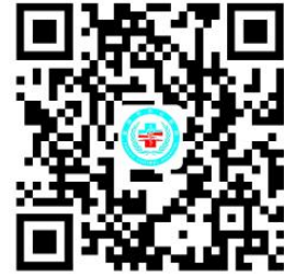
医院权力事项清单